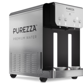
P2 Firewall™ Bar Classe