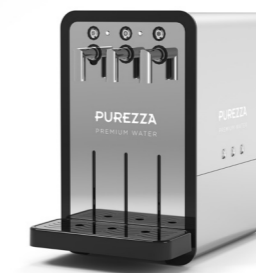
P1 Bar Series E